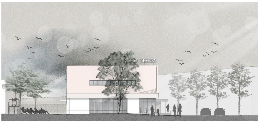
Elewacja północna kina Tęcza, projekt: Biuro Architekt Kaczmarczyk SC

Podczas modernizacji kina Tęcza, dużą uwagę poświęcono również kwestiom zrównoważonego rozwoju i ekologii. Dzięki zastosowaniu nowoczesnych technologii oraz materiałów o niskim wpływie środowiskowym, budynek kina będzie bardziej energooszczędny i przyjazny dla środowiska.