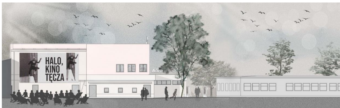
Elewacja południowa kina Tęcza, projekt: Biuro Architekt Kaczmarczyk SC

z taśmy światłoczułej. Niezależnie od źródła projekcji widzowie będą mogli cieszyć się dźwiękiem przestrzennym. Ponadto powstanie tu nowoczesna reżyserka, która umożliwi rejestracje i transmisje na żywo z wydarzeń, które będą odbywać się w kinie. Projekt akustyczny kina przewiduje możliwość przeprowadzania paneli dyskusyjnych i konferencji oraz organizacji kameralnych występów muzycznych.