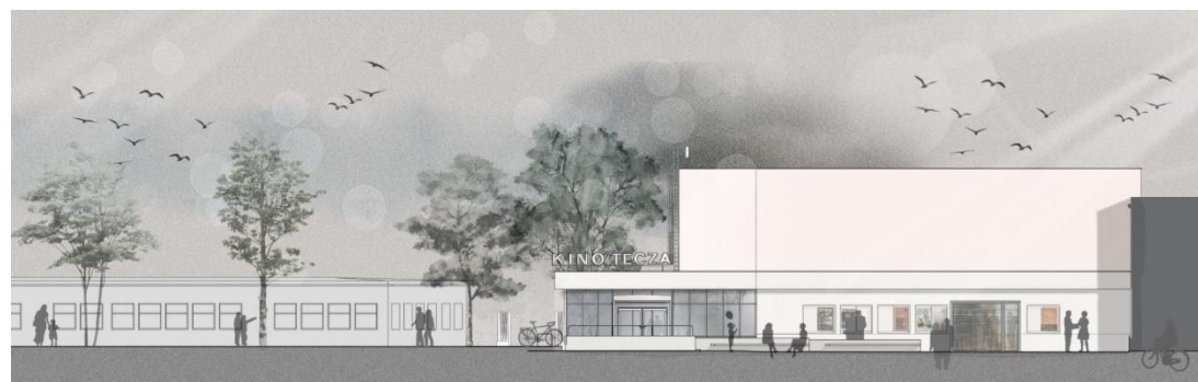
Elewacja zachodnia kina Tęcza, projekt: Biuro Architekt Kaczmarczyk SC